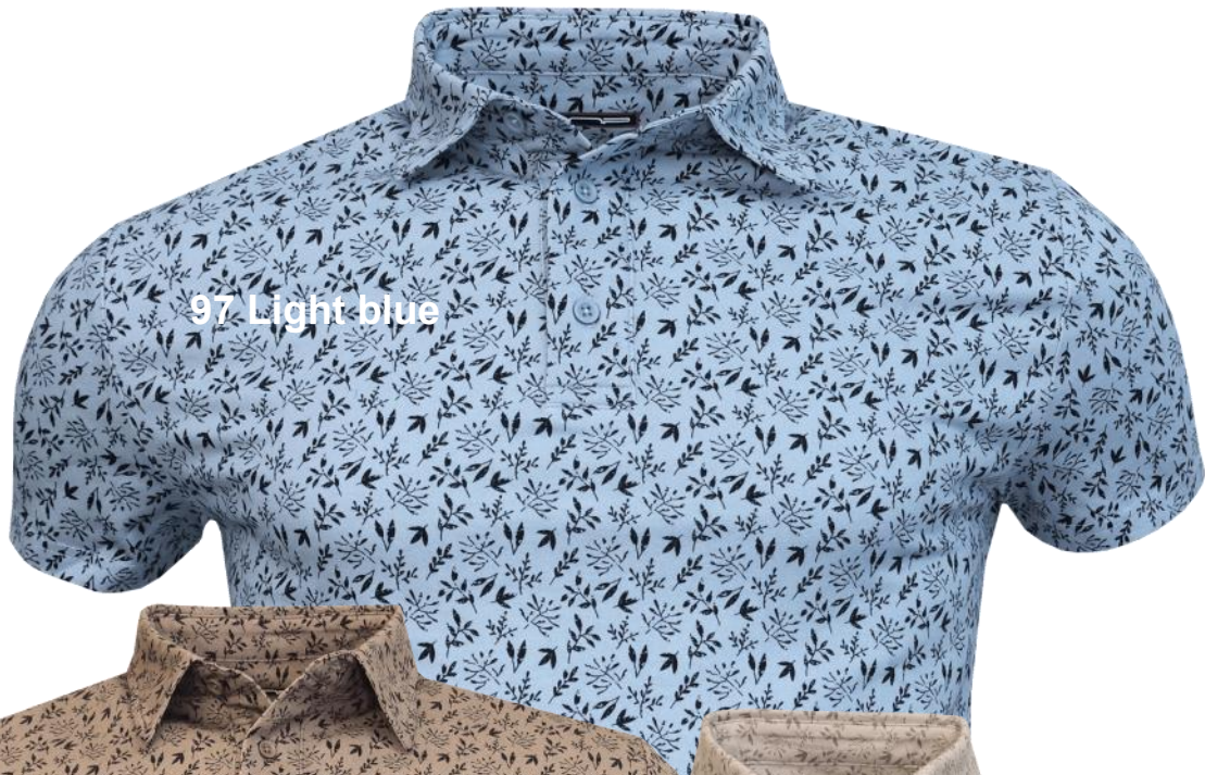
97 Light blue