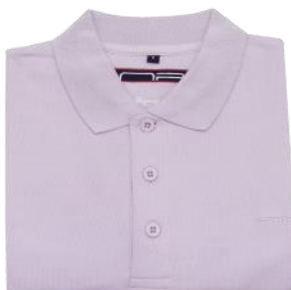
38 Misty lilac