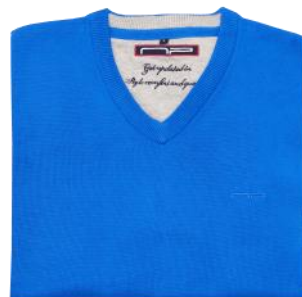
17 Bright blue