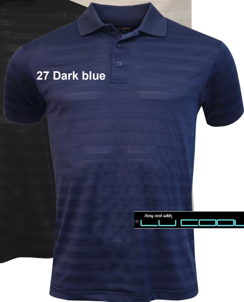
27 Dark blue