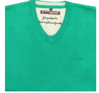
10 Mid green