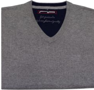
43 Grey melange*