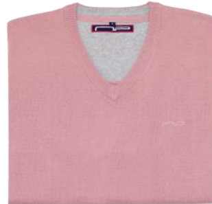
31 Soft rose*