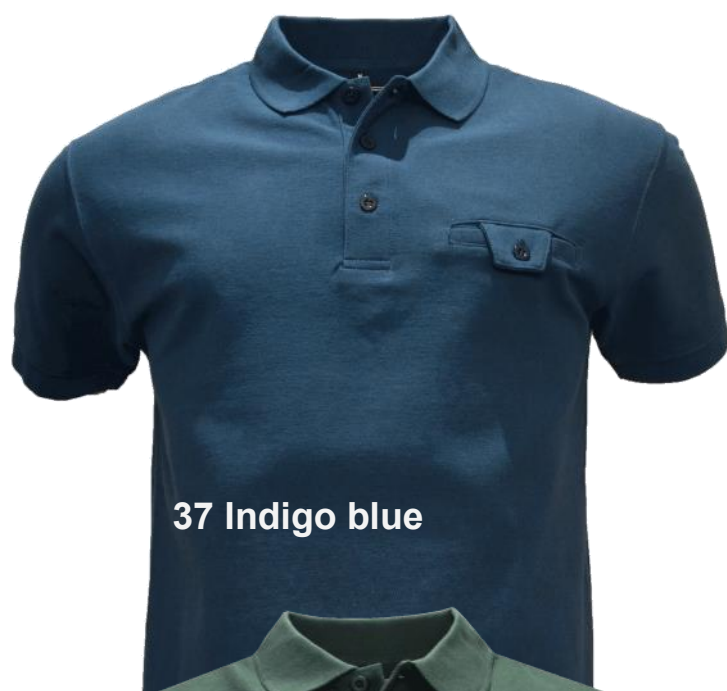
37 Indigo blue