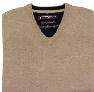
39 Mid beige melange*