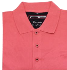
21 Mid rose*