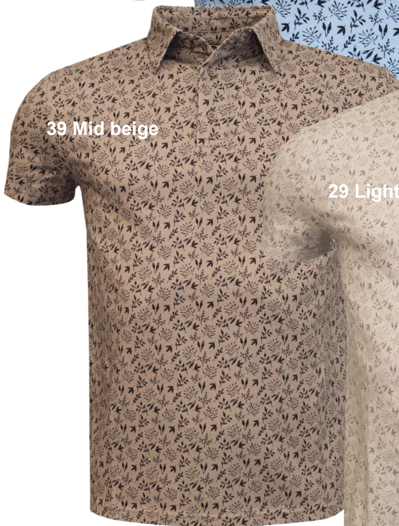
39 Mid beige