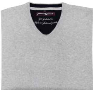
03 Light grey melange*