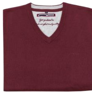
46 Dark red*