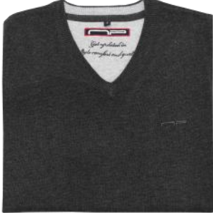
13 Cox melange*