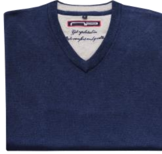
27 Dark blue*