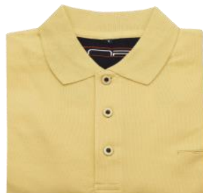
02 Amber yellow*