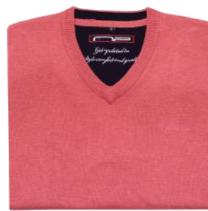
21 Mid rose