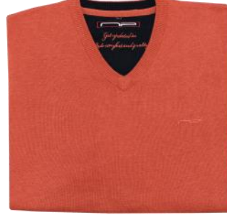
82 Odra melange*