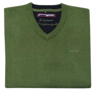
90 Leaf green