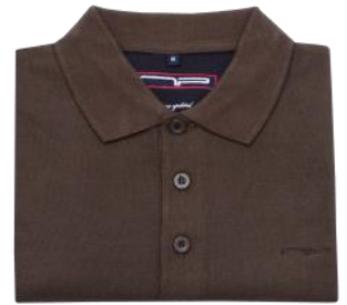
09 Dark brown*