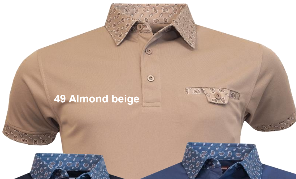
49 Almond beige