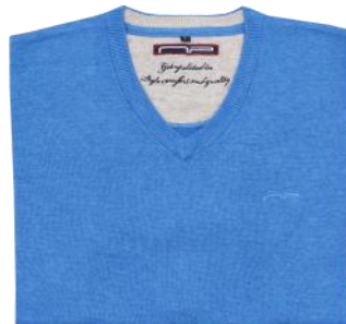
47 Mid blue melange