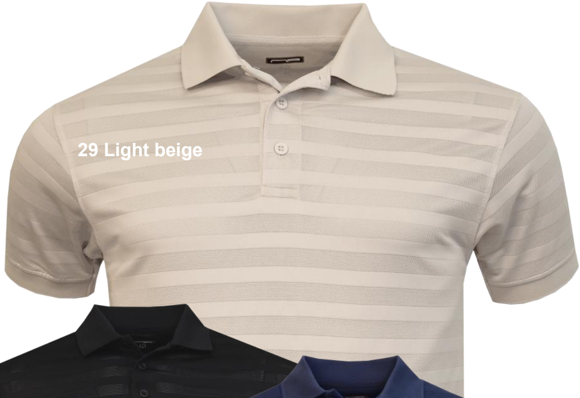
29 Light beige