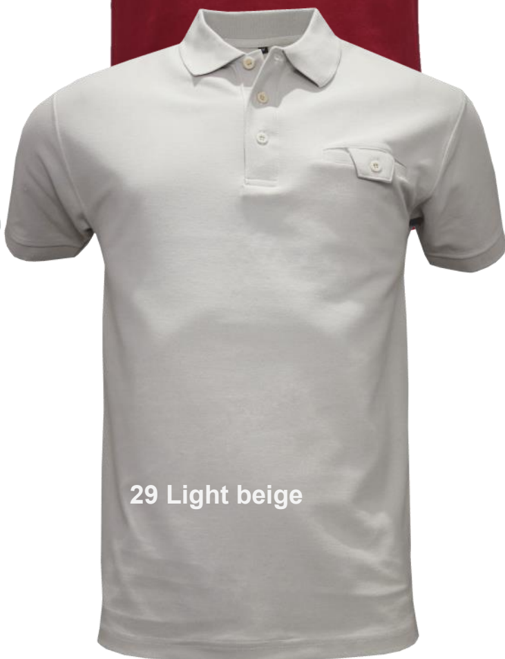
29 Light beige