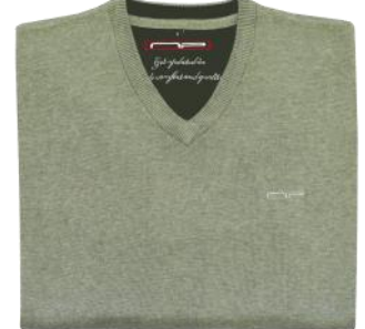
80 Lint green melange*