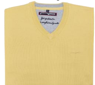
02 Amber yellow*