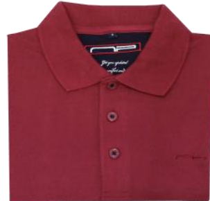
46 Dark red*