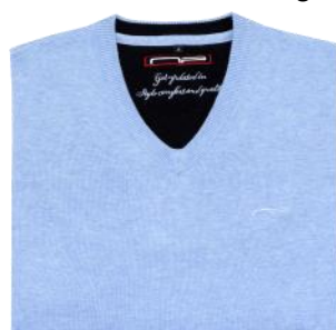
97 Light blue melange*