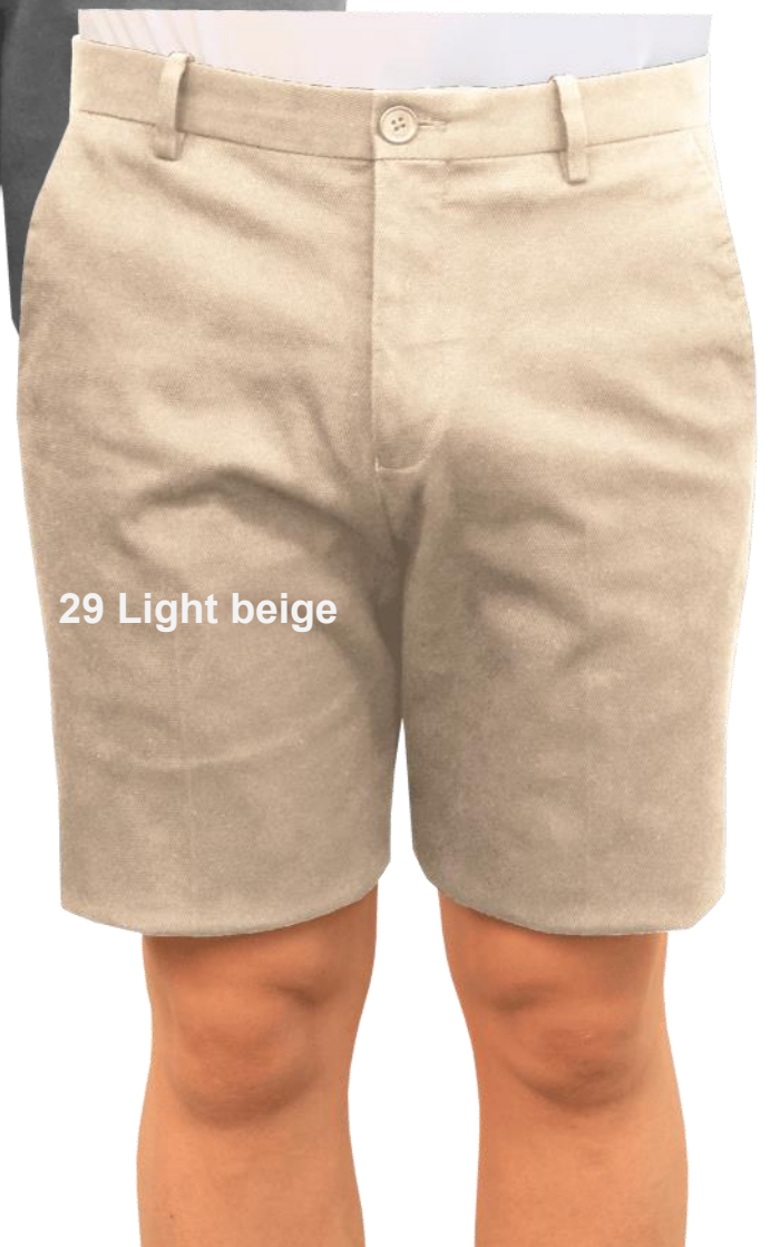
29 Light beige