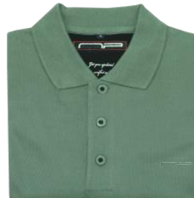
90 Leaf green*