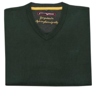
50 Bottle green