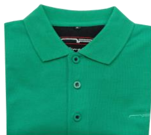
10 Mid green*