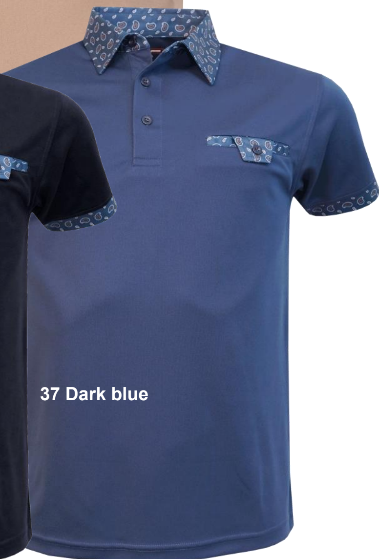
37 Dark blue