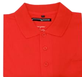
86 Spicy orange