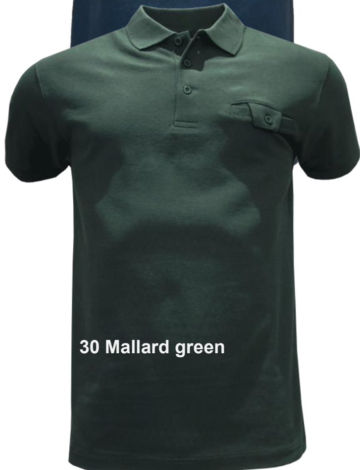
30 Mallard green