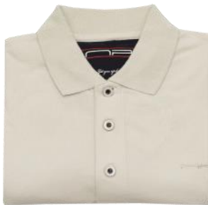
29 Light beige*