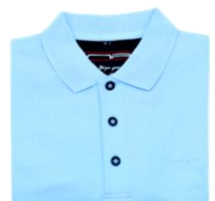
97 Light blue*