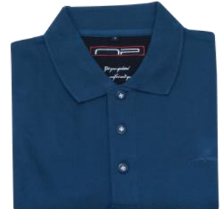
87 Sky blue*