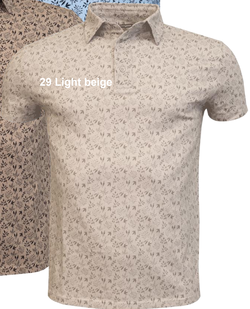
29 Light beige