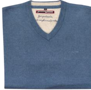
87 Sky blue melange