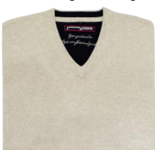
29 Light beige melange