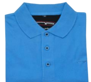
47 Mid blue